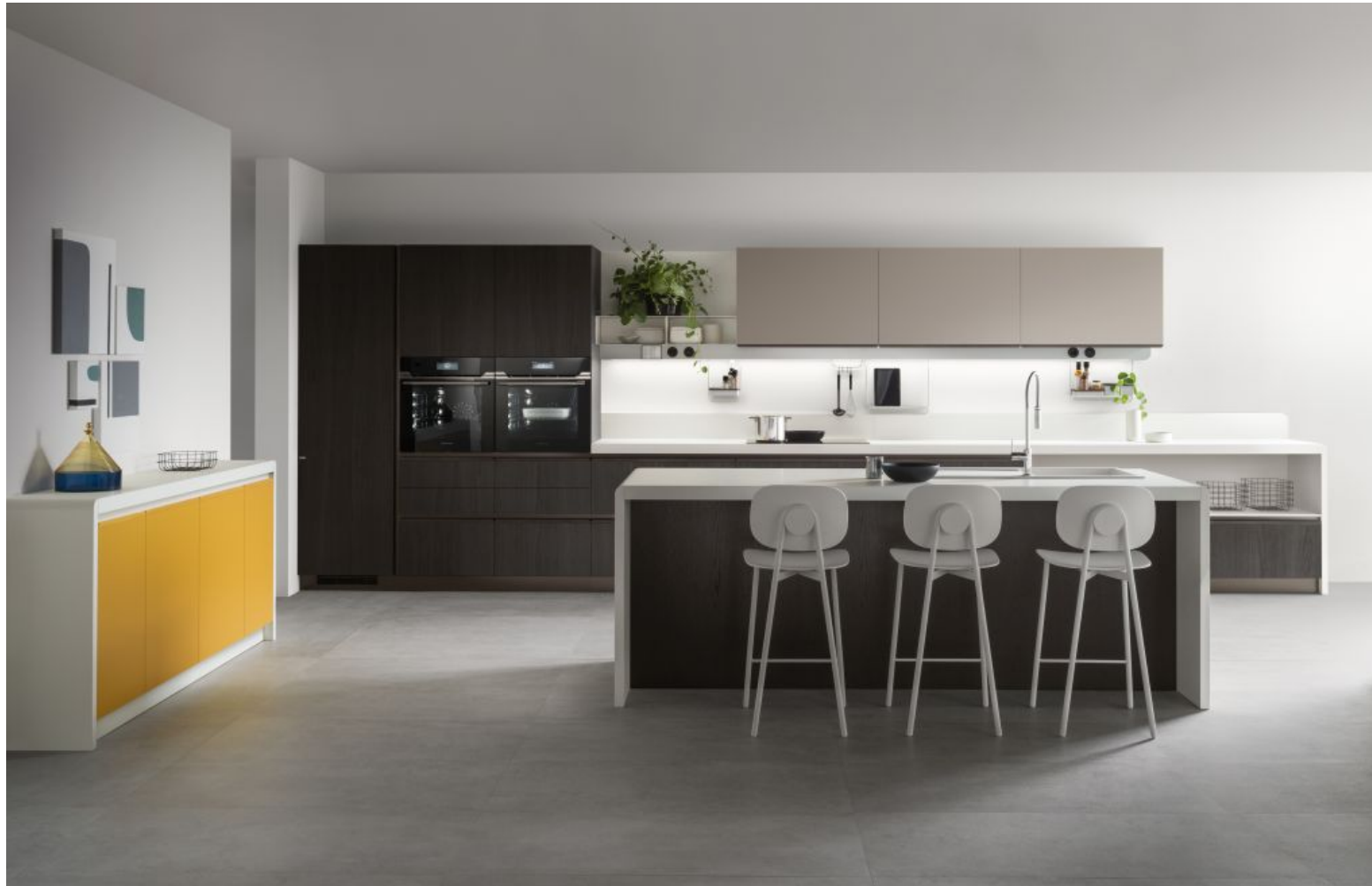
Scavolini: Dandy Plus rifinita dal profilo color Bronzo per la presa

Il profilo per l'apertura dell'anta del sistema d'arredo per cucina-living e bagno Dandy Plus , progettato da Fabio Novembre, modello "che parla" grazie ad Alexa, il dispositivo altoparlante intelligente che controlla i diversi impianti tecnologici attraverso BTicino Living Now. Lo speciale profilo sull'anta è uno dei dettagli che connota il modello e che si abbina a pulsanti, manopole e leve dei miscelatori ovvero quegli elementi che entrano in contatto con l'utente. I profili-maniglia sono in plastica riciclata con una particolare texture a sfere posizionate progressivamente fino a scomparire verso il bordo, peculiarità che genera una sensazione tattile. Sono 5 le vivaci colorazioni disponibili dei profili per le prese delle ante e dei dettagli personalizzabili: Rosso Corallo, Giallo Senape, Blu Agave, Bianco Prestige, Nero Ardesia; per le maniglie si aggiungono anche i colori Alluminio e il Bronzo che rifinisce le ante della soluzione nella FOTO SOPRA, con basi Rovere Carbone e laccato opaco Giallo Senape e pensili in decorativo Grigio Selce.