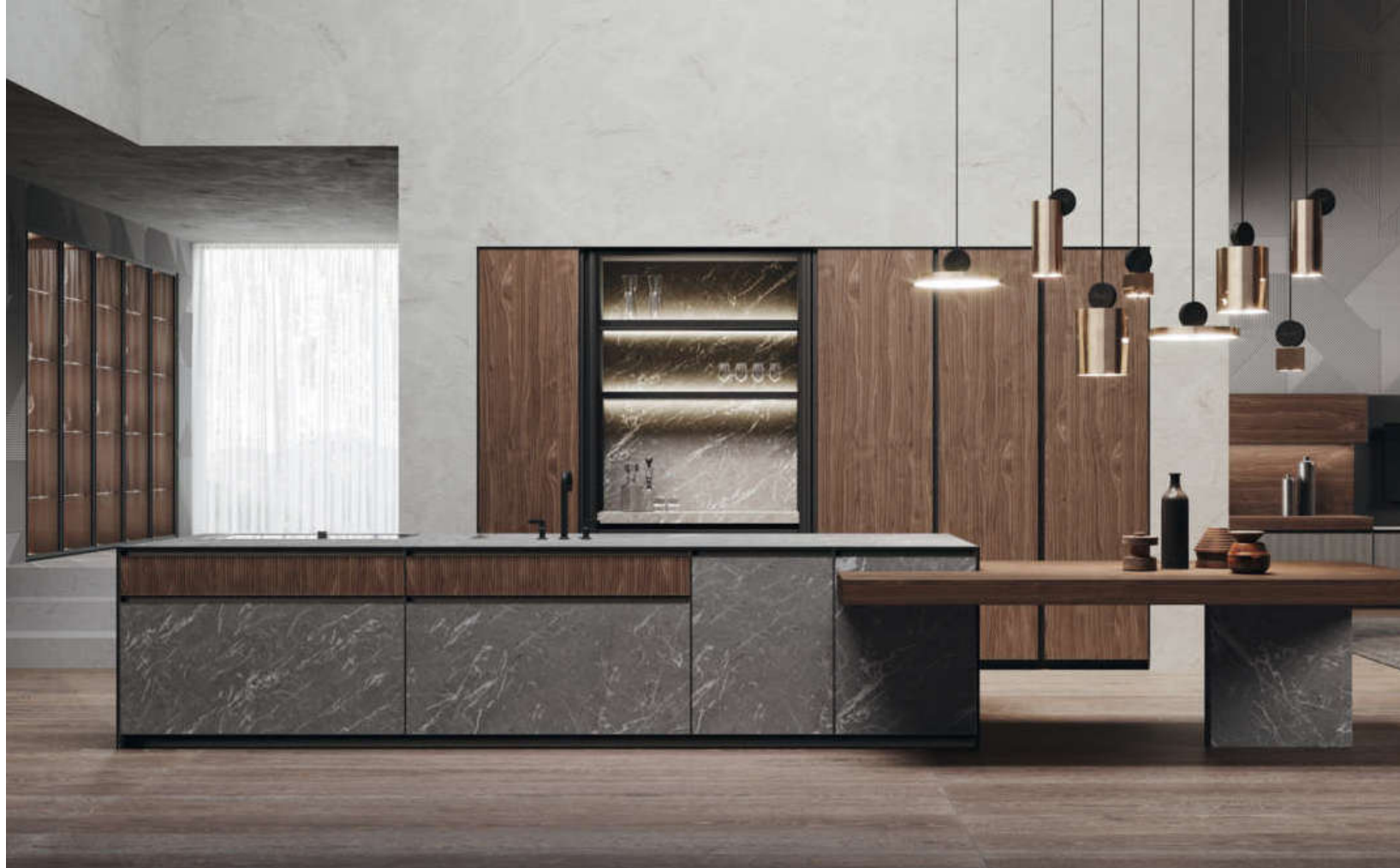
Binova: il telaio in alluminio di Avola è anche presa per l'apertura

Grande novità di Binova , il modello Avola concentra il design dell'anta sul telaio in alluminio a vista ed estremamente sottile, con un bordo visibile perimetrale di 3 mm che permette la presa mediante la maniglia integrata nel bordo superiore . Il telaio inoltre circonda differenti materiali come HPL, grès e vetro coniugando il ripetersi di linee verticali e orizzontali. I frontali della cucina Avola qui proposta sono in legno Noce Canaletto con texture rigata , una finitura di particolare eleganza, e in laminato HPL effetto pietra di Alicante . Trasversalità delle finiture e libertà progettuale sono i concetti che connotano questo nuovo di sistema, in cui si evidenzia la relazione estetica tra ante e piano di lavoro.