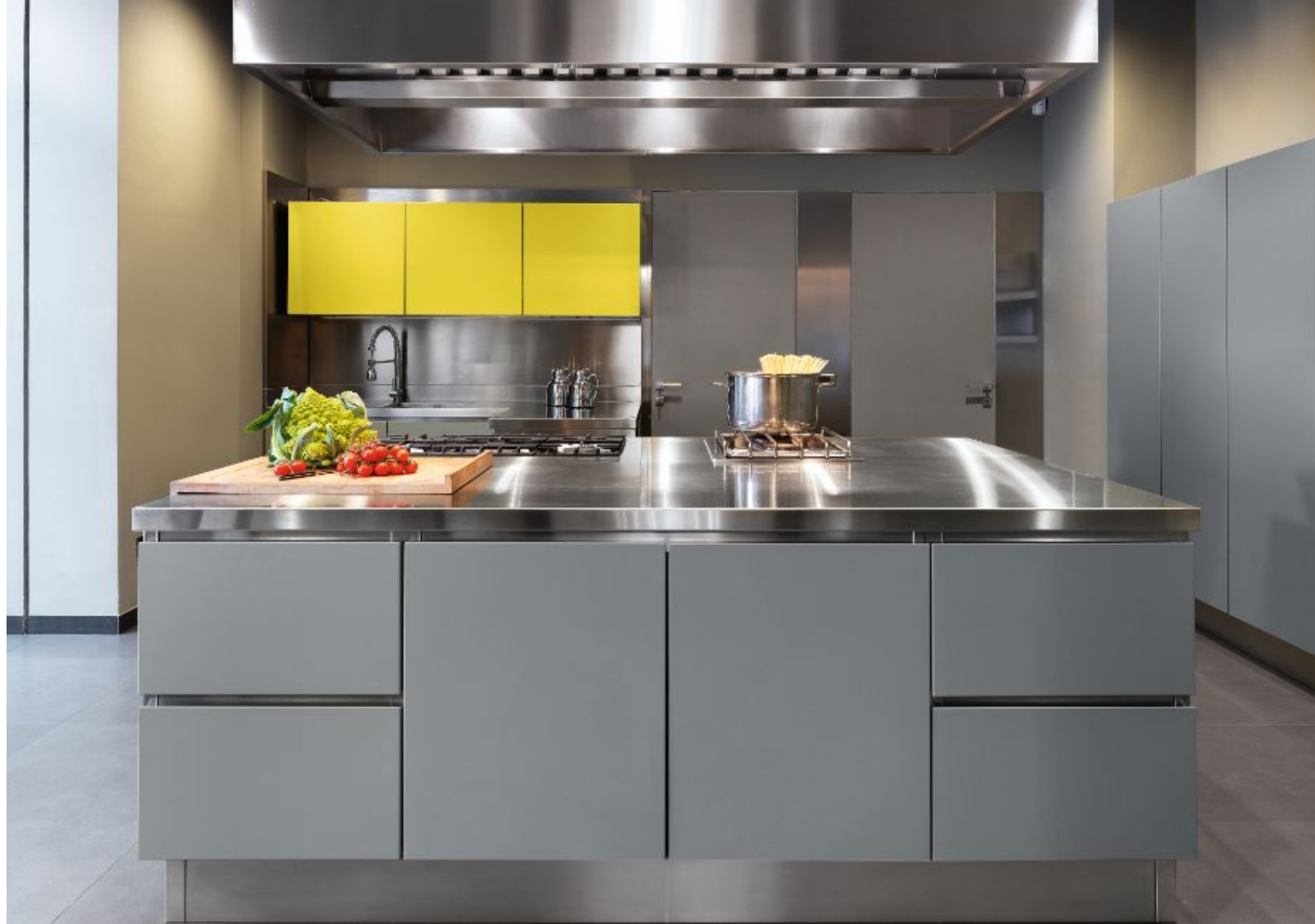
Abimis, sistema Atelier