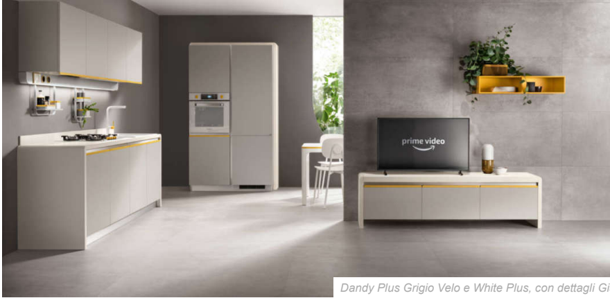
Dandy Plus Grigio Velo e White Plus, con dettagli Giallo Senape