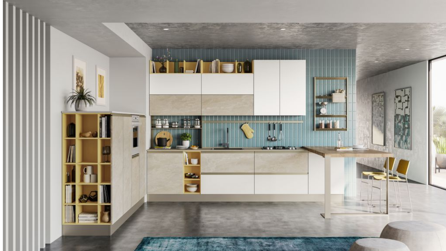
Creo Kitchens: il modello Tablet dotato di prese a gola. Versione in melaminico marmorizzato Trani e bianco soft

Giovane, connotata da un dinamico gioco compositivo che alterna volumi pieni e vuoti e superfici eleganti: è Tablet , di Creo Kitchens , modello con frontali lisci e prese a gola sempre intonate alle nuance di ante e cassetti. Innumerevoli le varianti di finitura previste per Tablet, come il melaminico con finitura opaca marmorizzata color Trani e con finitura Bianco Soft della cucina nella FOTO SOPRA . Elementi a giorno e librerie alleggeriscono questa soluzione che si avvale di un tavolo a sbalzo e di colonne ad altezza ergonomica con terminale a libreria finito in una delicata tonalità di giallo , coordinato agli altri elementi a giorno . Tra le innumerevoli versioni di Tablet, si annovera quella con basi in melaminico finitura materica fiamma verticale Rovere Ortisei e pensili melaminico finitura super opaca Rosso Cardinale (NELLA GALLERY SOTTO), che si completa con la libreria Totem con vaschette.