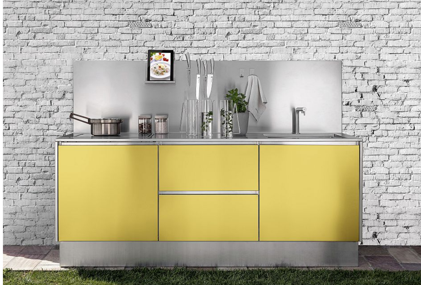
I frontali lisci della cucina Atelier Outdoor, di Abimis, creta per una casa a Mondello (PA)

Atelier di Abimis è un sistema completamente custom made ed è costruito in acciaio inox secondo un'idea di cucina minimalista , con frontali piani e lisci con angoli vivi . Sui frontali non ci sono prese né profili perché l'apertura viene affidata al sistema push-pull . I vani interni, al contrario, sono stondati per permettere una veloce pulizia a favore della massima igiene. L' effetto pulito dei frontali è ottenuto anche dal materiale impiegato: l'acciaio naturale o verniciato in qualsiasi colore , così come è previsto per le strutture.