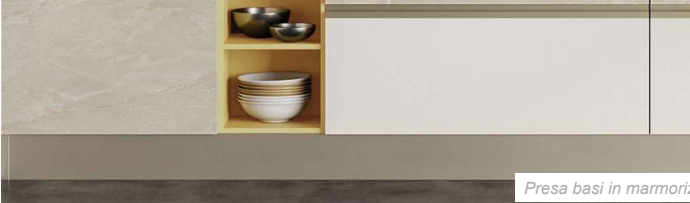
Presabasi in marmorizzato Trani e bianco soft