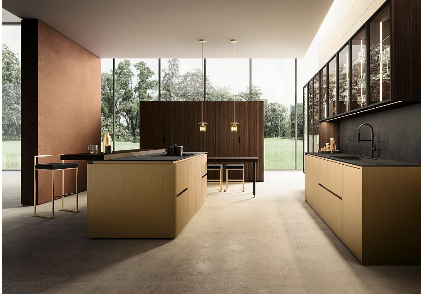
L'apertura a gola piatta di Linea 30 versione HD, di Composit

Preziosa per i frontali in laccato opaco metallo effetto graffiato oro , il modello Linea 30 versione HD, di Composit , prevede, per l'apertura delle ante, un profilo a gola piatta e pannelli frontali con terminali smussati a 30° per facilitare le prese di ante e cestoni . Il risultato è un modello dalla linea pura , che minimizza al massimo le forme e lascia alla materia il ruolo di protagonista . Ai frontali dorati si abbina quindi il legno di Eucalipto dell'armadiatura e il top in Laminam Calce Nero dell'isola multifunzione , con vano giorno sotto il piano snack. Sopra le basi, pensili con ante in vetro a telaio, riprese dalle due colonne terminali. Particolari le colonne da 120 cm in legno di eucalipto con anta a scomparsa che nascondono vani, elettrodomestici e accessori.