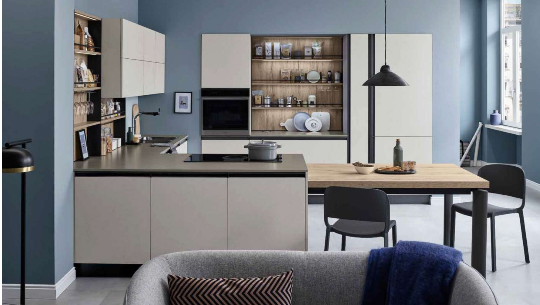
Start Time Presa, di Veneta Cucine, prevede la speciale presa integrata nell'anta

Apertura delle ante semplice e di carattere per Start Time Presa di Veneta Cucine , sistema contemporaneo e giovane che si annovera tra quelli di maggior successo del brand. Progetto che interpreta appieno il concetto di "Quick Design", la cucina Start-Time Presa si connota per lo speciale profilo per l'apertura realizzato in alluminio e integrato sul bordo superiore di ante e cassetti , disponibile in due finiture: Brunito e Bronzo . Il sistema Presa è uno di quelli previsti per Start Time , che prevede anche altri tipi di prese : il profilo Start-Time.Go, che utilizza la maniglia a incasso, il sistema con profilo J e la tradizionale maniglia. NELLA FOTO SOPRA: Start Time Presa con Presa nella finitura brunita, basi, colonne e pensili in finitura Graffiato chiaro e top Caranto Quartz Cemento Perlato.